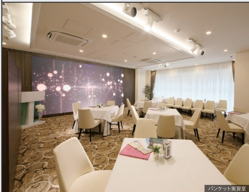
バンケット実習室

デザインプロデュース：KEN OKUYAMA DESIGN / 総合監修：DUCE