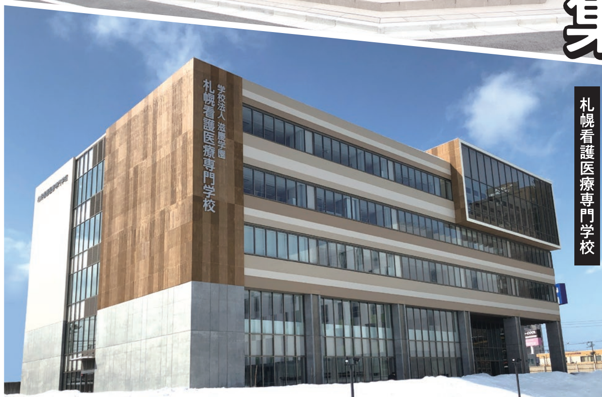
東京ホテル・ウエディング&IR専門学校 札幌看護医療専門学校