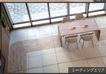
ミーティングエリア