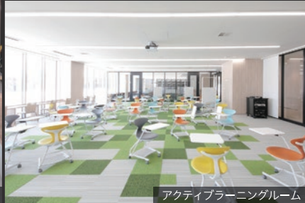
アクティブラーニングルーム