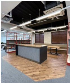
左/広々としたオフィスエリア 右/オフィス中央には集まれるカフェスペースを設置

滋慶ビル 滋慶学園ビル北浜への移転に合わせて、滋慶ビルも改装しました。 グループのIT・WEBセクションの拠点となるビルにということも踏まえ、フレキシブルな業務に対応できるように、従来の固定席からフリーアドレス制に。個人ロッカーやワゴンを活用し、常に整理整頓されたオープンなオフィスへとリニューアルしました。