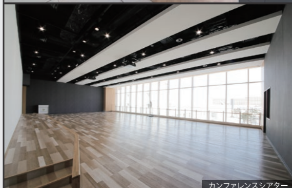
カンファレンシアター

札幌看護医療専門学校に期待を抱いて学校に来られた方々のモチベーションが上がる空間を目指して計画しました。ホテルのような「スタイリッシュ」な内装と、つながるベンチやカウンターなどの遊具のような造作家具や、イスやグラフィックにカラフルな色合いを取り入れて、「遊び心」をコンセプトにデザインを行いました。