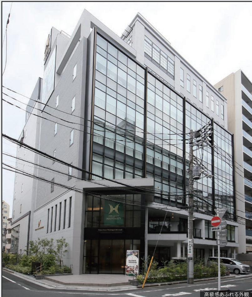
高級感あふれる外観