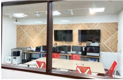
▲ クールで木目とスリットを上写真のようなデザインで職人さんに貼り付けてもらい、低コストで意匠性の高い壁面に仕上げました。

普通教室を40人が入るPCルームに変更するための改装。 床・壁・天井をつなげ、奥にアイキャッチのグリーンを置いたデザイン。インパクトはありつつも色目は抑え、デスクは木目をベースに優しく、チェアはポイントに赤色をつかいて印象的かつ落ち着いた空間を演出しています。