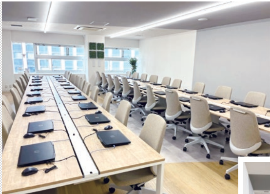
▶ クールかつカジュアルなデザイン、解放感のあるPCルームに仕上がりました。壁や天井・床を緩やかな斜めにぐるりとグレーで囲む切り替えや、奥に視線がいくようなデザインで広く感じられる空間にしています。「費用を抑えて手間をかける」そんなこだわりのある教室づくりを心がけています。

普通教室を40人が入るPCルームに変更するための改装。 床・壁・天井をつなげ、奥にアイキャッチのグリーンを置いたデザイン。インパクトはありつつも色目は抑え、デスクは木目をベースに優しく、チェアはポイントに赤色をつかいて印象的かつ落ち着いた空間を演出しています。