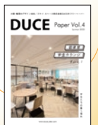
vol.04 表紙 東京医療看護専門学校 第4校舎